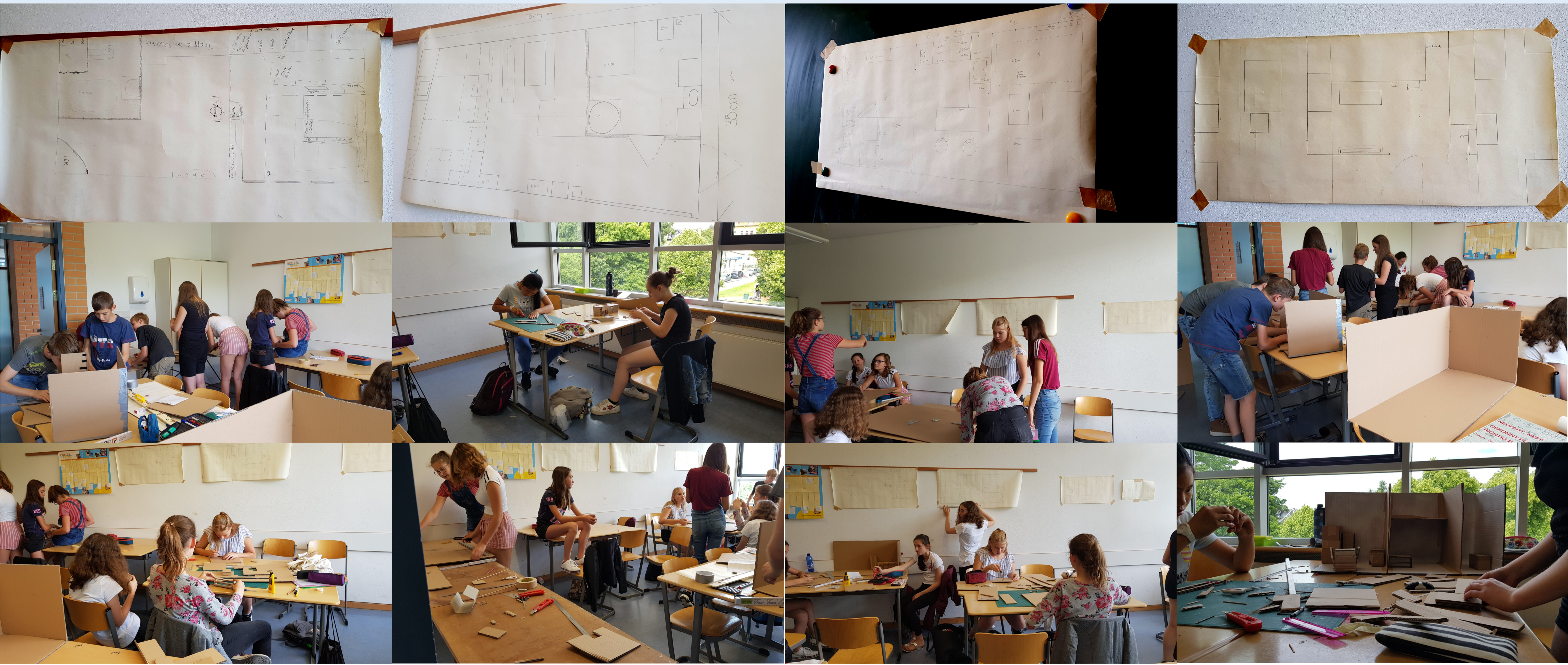
Tag 3 > Fertigstellung Modellbau + Fotografie mit Maßstabsfigur Mensch . Interne Präsentation der 4 Teams_ Herausstellen Highlights jeder Arbeit und Verbesserungsideen durch Gedankenaustausch