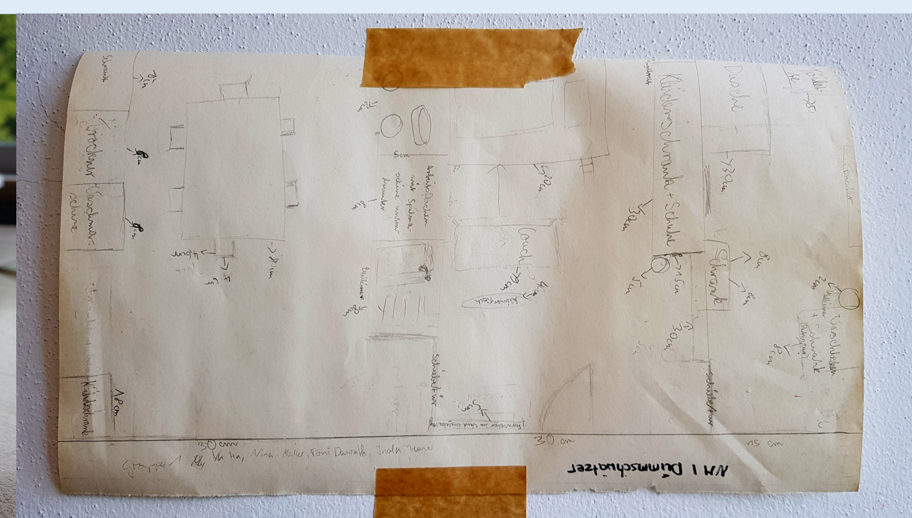
Tag 2+3 > Grundrissplan M 1:10 mit Höhenangaben_ Tag 2+3 > Modellbau (Arbeitsmodelle Innenraum M 1: 10 aus Wellpappe)