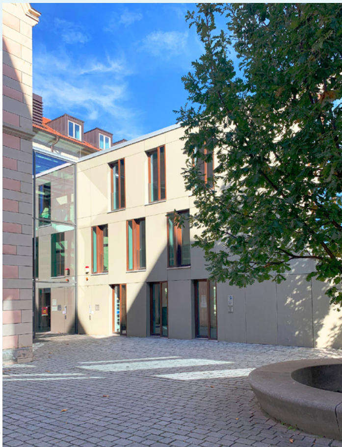
Collegium Maius, Erfurt, Bild: AKT

Donnerstag, 8. Juni 2023, 14:30 bis ca. 18:30 Uhr, Collegium Maius, Michaelisstraße 39, Erfurt