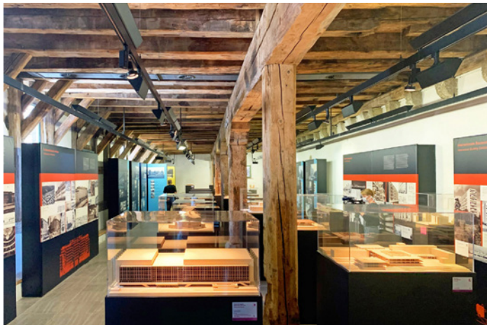
Ausstellung „Zwei deutsche Architekturen 1949–1989“ in der Galerie Waidspeicher im Erfurter Krönbacken im Sommer 2020

Öffnungszeiten: Mo, Mi 11:00–17:00; Di, Do 13:00–19:00; Fr 11:00–15:00; Sa 13:00–17:00 (Ab 19.06.2023 ist die Ausstellung zu den Öffnungszeiten des Neuen Rathauses zugänglich.) Der Zutritt zur Ausstellung ist kostenfrei und rollstuhlgerecht.