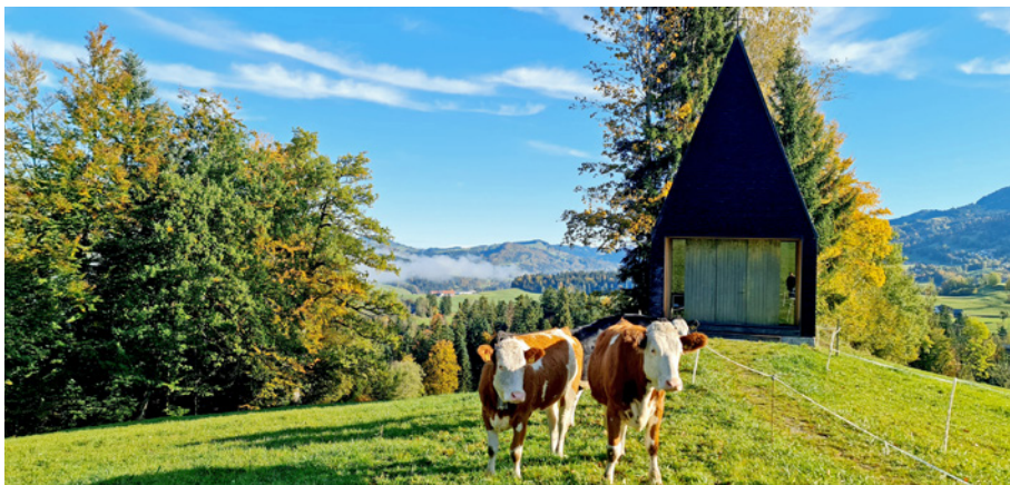
oben links: Islamischer Friedhof Altach, Bernardo Bader Architekten; unten und rechts: Kapelle Salgenreute, Bernardo Bader Architekten

Unter dem Motto „Wir ehret das Oalt und grübet das Nü.“ brachen zwölf Freunde der Baukultur aus der planenden, handwerklichen, künstlerischen und lehrenden Zunft zu einer Architekturexkursion in unser Nachbarland Österreich auf.