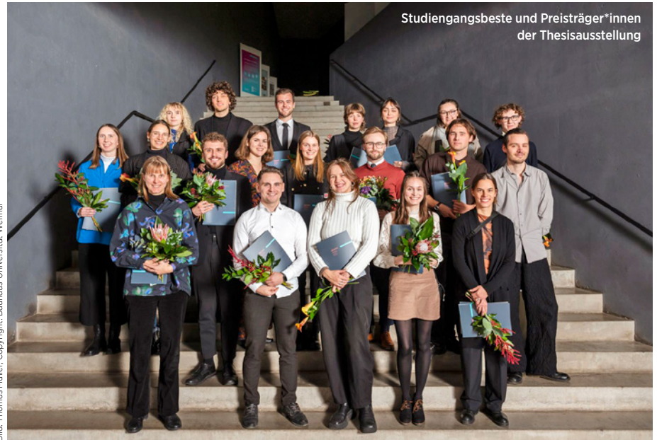
Studiengangsbeste und Preisträger*innen der Thesisausstellung

Auszeichnungen für herausragende Abschlussarbeiten Architektur und Urbanistik an der Bauhaus-Universität Weimar