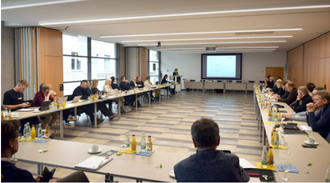
Vertreterinnen und Vertreter am 17. November 2023 im Comcenter Brühl in Erfurt

Kammerparlament wählte Besetzungen der Ausschüsse, beschloss Haushaltsplan 2024 mit Beitragserhöhung sowie Änderung der Fortbildungsordnung