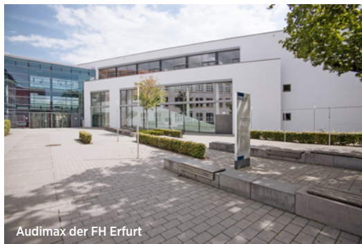
Audimax der FH Erfurt

📄 https://eveeno.com/ErfurterBaurechtstage2024